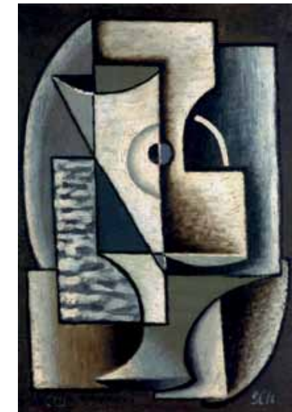
Serge Charchoune (1888-1975): 'Cubisme ornamental n° 10', 1922. Olieverf op doek, gemaroufleerd op paneel, 34 x 24 cm. Te zien bij Galerie Applicat-Prazan, tijdens de Nocturne Rive Droite.

Nocturne Rive Droite Faubourg Saint-Honoré tot Avenue Matignon Parijs www.art-rivedroite.com 05-06